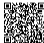
事例発表の二次元コード

(3) 配送方法：11月19日（火）～21日（木）地域振興課経由（株大松運輸）で自治会町内会へお届け