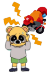
横浜市交通安全キャラクター まもるくん